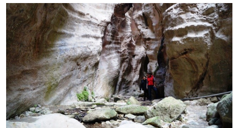
Ущелье Авакас в национальном заповеднике

над морем. В таверне предлагают традиционные кипрские блюда, горячие и холодные напитки.