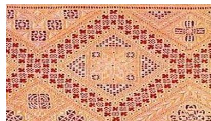
Традиционные кипрские кружева

Деревня расположена на высоком холме и славится не только кружевами, но и традиционной архитектурой. Красивые улочки, выделяются белоснежностью домов с ярко синими дверьми и оконными рамами, что характерно для кипрских жилых строений.