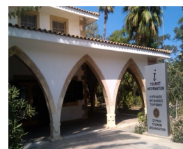
Здание информационного офиса (КОТ)