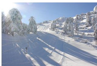
Подъемник на трассу «Зевс»

стороны Олимпа. Трасса Гермес – 150 мет-