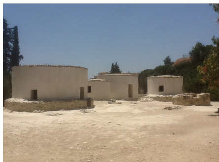
Хирокития, жилые постройки

11 тыс. лет назад на Кипре поселились пришедшие с материка люди. Постепенно культурное развитие пришедших людей начало развиваться самостоятельно и в 7 тысячелетии до н.э. достигло расцвета. Ярким примером неолитической культуры на Кипре является поселение Хирокития. Это архитектурное сооружение включает все важные элементы жилого поселения: дома, защитные стены, захоронения, а также