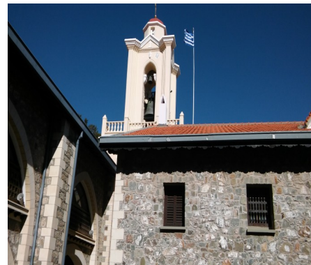
Колокольня во дворе монастыря

ходится вымощенный двор с колодецем. Внешние стены и открытые коридоры монастыря отреставрированы и украшены различными картинами религиозного характера. Большинство картин представляют собой мозаику (из эмали и стекла с позолотой) и украшают вход и стены внутреннего двора и коридоров, гармонизируя с архитектурными особенностями комплекса. Как мозаики, так и фрески, были созданы в 1991-3 годах кипрскими иконописцами братьями Кепола и другими мастерами.