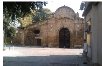
Пафосские ворота. Никосия.