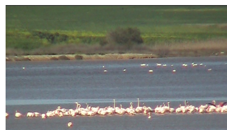
Дикие фламинго на соленом озере в Ларнаке

Соленое озеро 3700 лет назад было частью побережья и служило естественным морским портом. После землетрясения озеро было отрезано от моря и преобразовалось в болотистую местность, которая служит временным домом более 80 видам перелетных птиц, в том числе для фламинго.